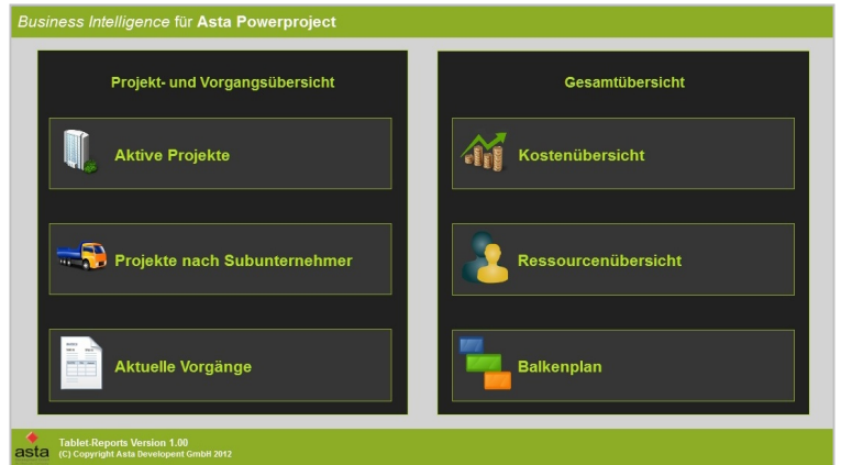
Individuelle Auswahl relevanter Betrachtungen

Verschiedene Berichtsvorlagen werden mitgeliefert sowie intuitiv zu bedienende Werkzeuge, mit denen personalisierte, professionell dargestellte Berichte generiert werden können.