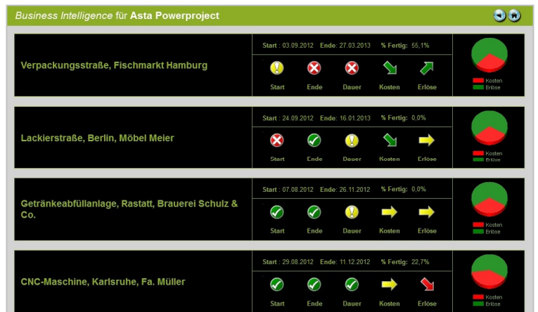
Die wichtigsten Kennzahlen aller Projekte in einer Ansicht

Berichte können in verschiedenen Formaten veröffentlicht werden, wie etwa Excel, PDF, HTML, XKM, TIFF und CSV. Dadurch lassen sich Daten innerhalb des jeweils gewünschten Formates weiterverarbeiten.